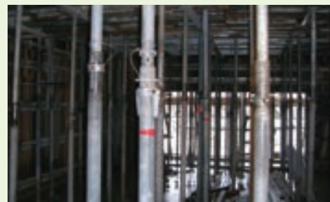
解体前（打設後約2日目）