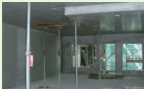
一般支保工解体後（打設後約4日目以降）