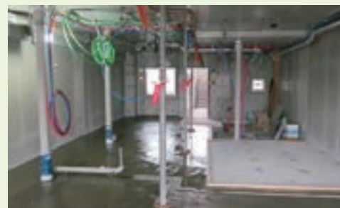
床レベリング工事